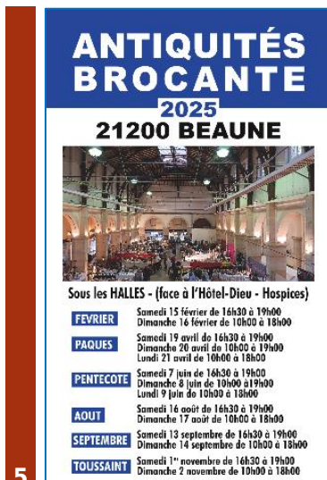
5 ••• BEAUNE (21)