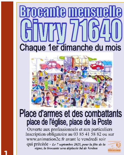
1 •• GIVRY (71)